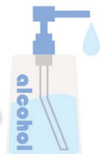
アルコール ジェル