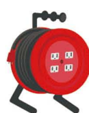
電気コード リール

例えば単1電池を使う懐中電灯の電池が切れてしまったのに単3電池しかないという場合に役立ちます。