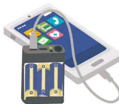
乾電池式スマホ充電器

発電機 使用前にはよく説明書を読んで、取扱いに十分注意しましょう。 ※燃料の確認もお忘れなく