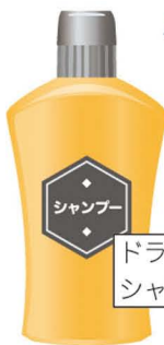
ドライ シャンプー