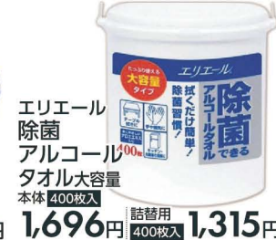
エリエール 除菌 アルコール タオル大容量 本体 400枚入 1,696円 詰替用 400枚入 1,315円