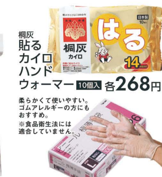
桐灰 カイロ ハンド ウォーマー 10回入 各268円