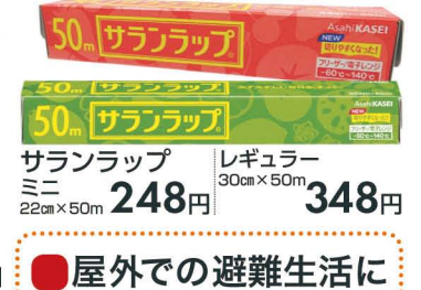
50m サランラップ レギュラー 30cm×50m 348円 ミニ 22cm×50m 248円