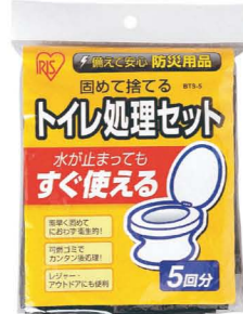
トイレ 処理セット BTS-5 5回分 760円