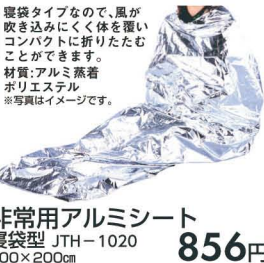
非常用アルミシート 寝袋型 JTH-1020 100×200cm