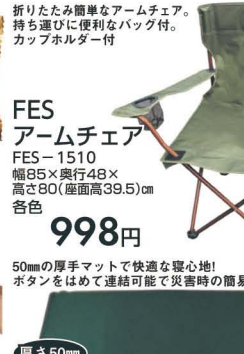
折りたたみ簡単なアームチェア。 持ち運びに便利なバッグ付。 カップホルダー付 FES アームチェア FES-1510 幅85×奥行48× 高さ80(座面高39.5)cm 各色 998円